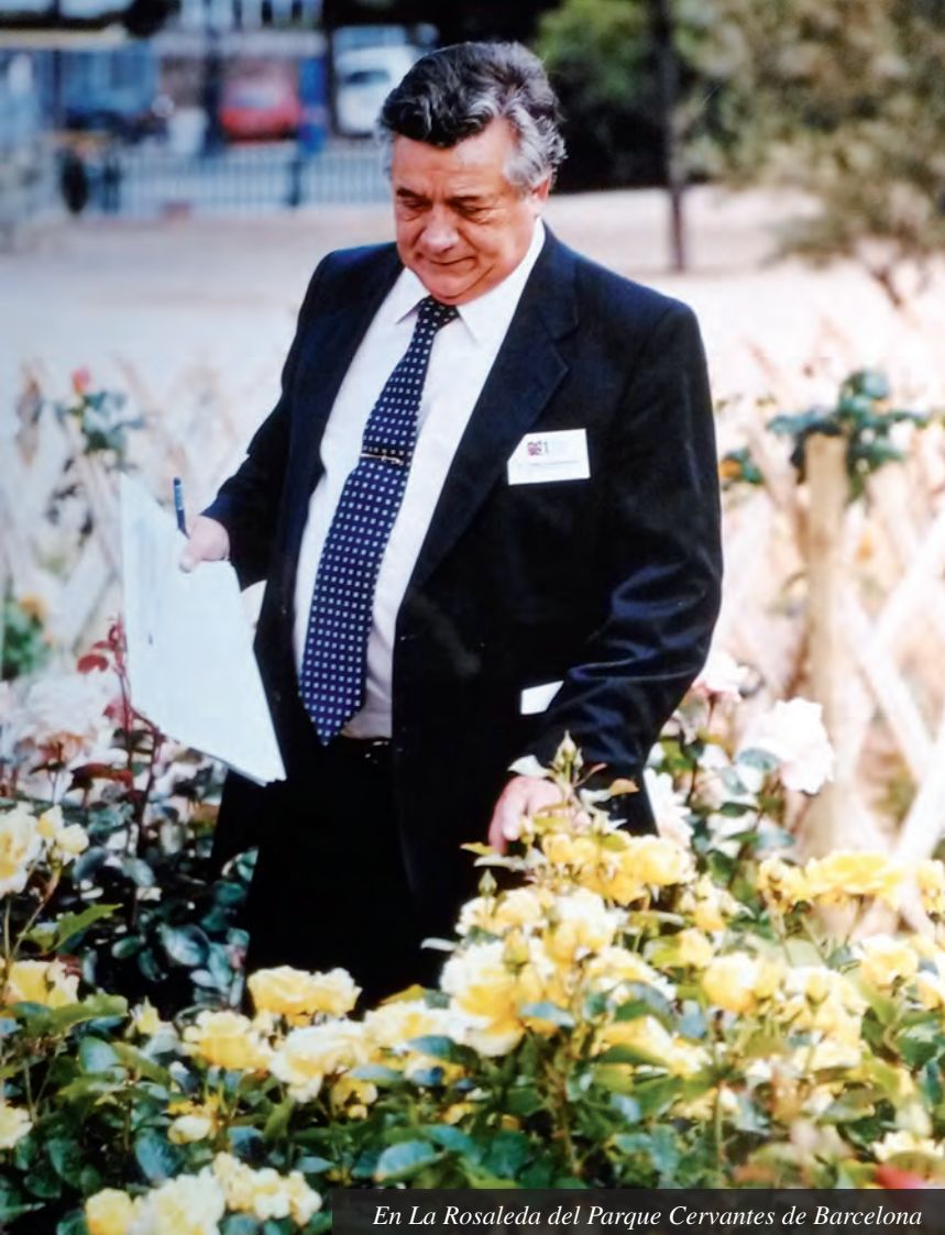
En La Rosaleda del Parque Cervantes de Barcelona

ba y aquí he estado con diferentes cargos en la plantilla municipal durante 49 años hasta la jubilación forzada a los 70 años como Adjunto a la Jefatura del Servicio que ocupaba un arquitecto.