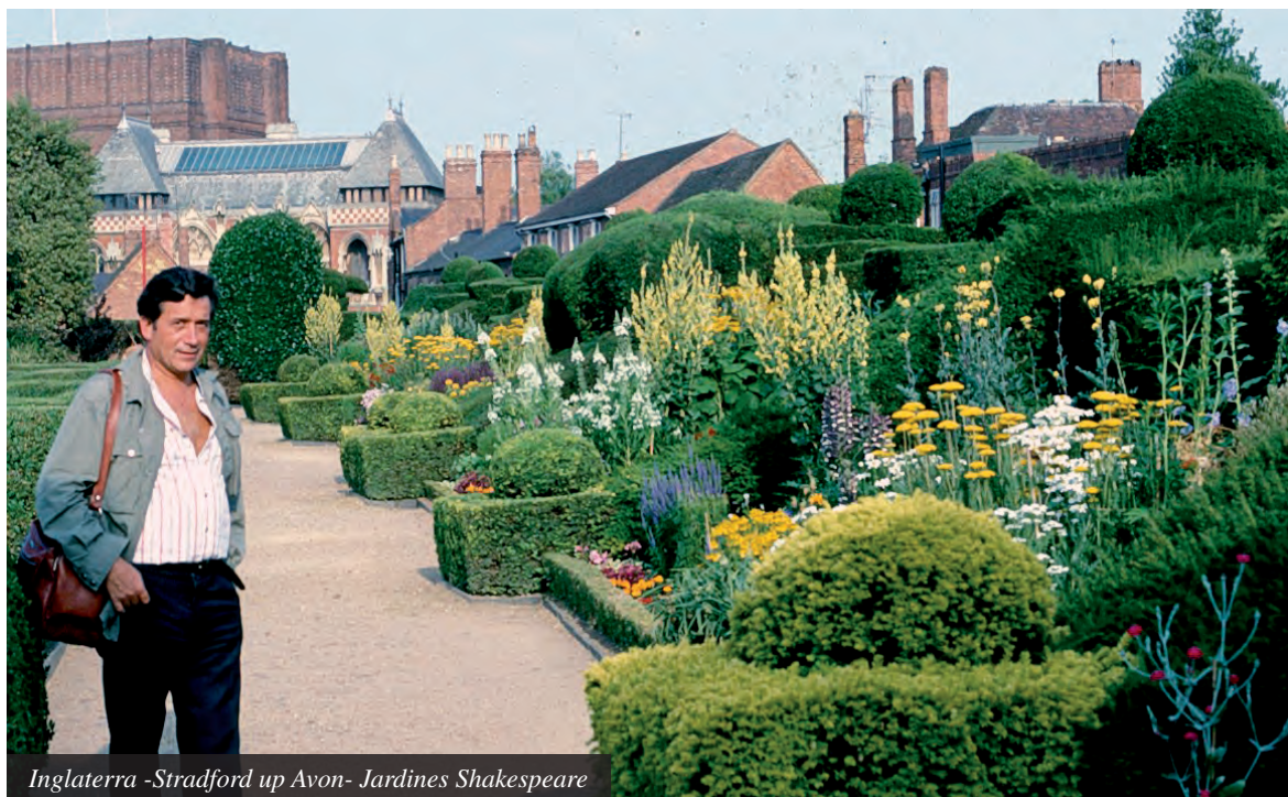
Inglaterra -Stradford up Avon- Jardines Shakespeare

Políticos, técnicos y ciudadanos deben colaborar en la protección y mantenimiento de los árboles heredados y en la planificación de las nuevas plantaciones.