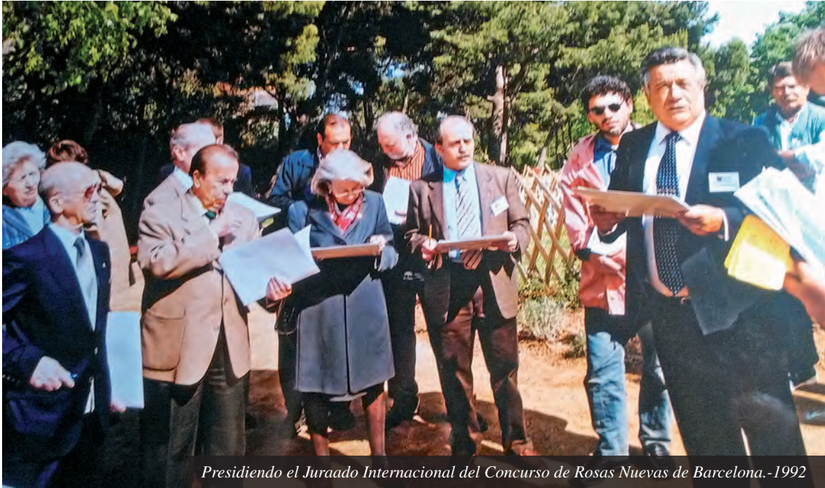
Presidiendo el Jurado Internacional del Concurso de Rosas Nuevas de Barcelona.-1992

No tiene por qué ser así si se ha consensuado un Plan de Gestión del Arbolado, o sea que de una vez sepamos qué es lo que queremos. Me da mucha pena ver como, por cambio de criterios, se les producen a los árboles heridas importantes e innecesarias para su desarrollo en el lugar que ocupa. Me indigna la estupidez de recortar los naranjos en las calles, no digo que, en algunas calles, en las que no deberían haberse plantado, se proceda así, pero no generalicemos por favor. Los árboles, como las personas, alcanzan su altura total y de allí no crecen más en su forma natural. En la naturaleza tienen sus alturas, en la ciudad son más reducidas.